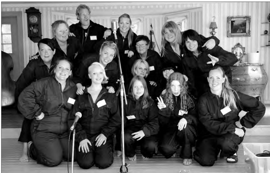
Ett glatt revygång. Revyn "En revy, en kommun" hade sin premiär på Teater Klämman den 15 juni. Förutom teater, bjuder kulturförening på en mängd olika musikkvällar under sommaren.